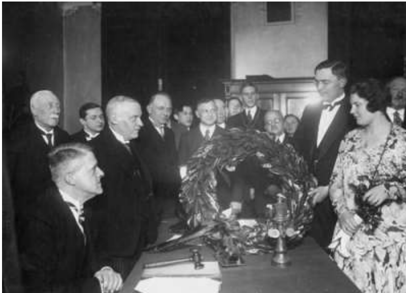
Dr. Max Euwe wereldkampioen schaken in 1935

Ons eeuwenoude en koninklijke spel kan een belangrijke rol spelen bij de leerontwikkeling van jonge kinderen en zij kunnen met het spel algemene vaardigheden aanleren of verbeteren waarvan zij levenslang plezier kunnen hebben. Onze landgenoot en oud-wereldkampioen prof. dr. Max Euwe, wiens hart niet alleen bij het schaken lag maar ook bij het onderwijs, was deze mening ook toegeedaan. Hij was, een jaar na zijn wereldkampioenschap, betrokken bij de oprichting van 'de Stichting tot bevordering van het schaken onder de schooljeugd'. In 1936 vond ook het eerste schoolschaakcongres plaats, dr. Euwe hield op dit congres een inleiding over schaken en schaken leren op school.